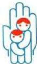
Комиссия по делам несовершеннолетних и защита их прав