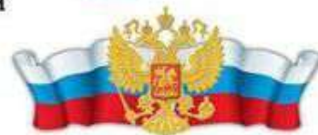
Министерство внутренних дел Российской Федерации