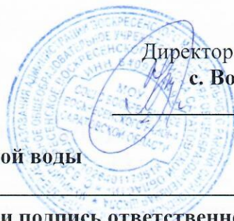
График смены кипяченой воды